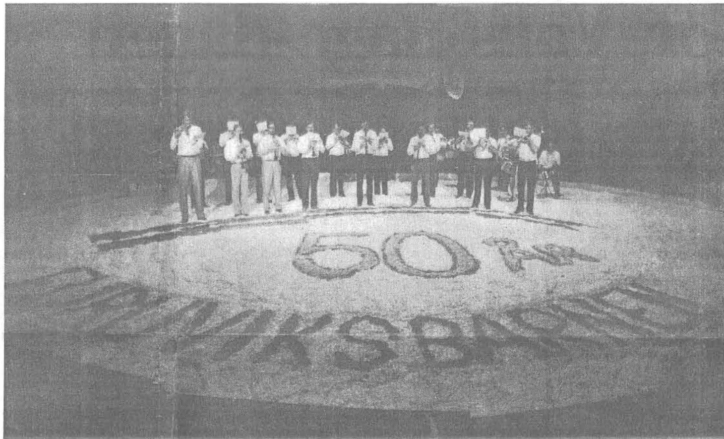
■ Gossorkestern bröt mot det amatöristiska mönstret – många av medlemmarna är numera yrkesmusiker – och var klart bäst när Furuviiksborna i lördags firade 50 år med nostalgisk veteranföreställning.